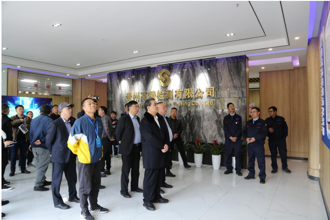
张鹏董事长向观摩组一行介绍公司情况

六盘水市人民政府有关负责同志、盘州市人民政府有关负责同志、红果开发区有关负责同志参加现场观摩活动。