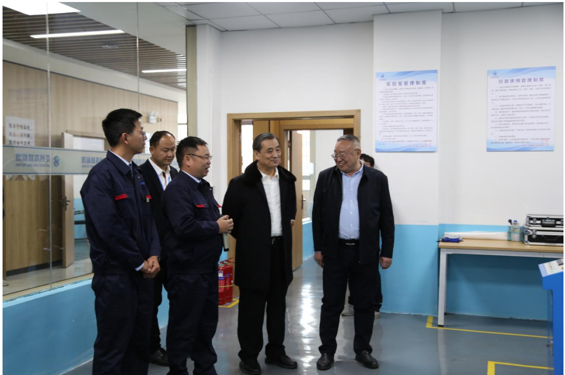
观摩组一行参观粉尘实验室