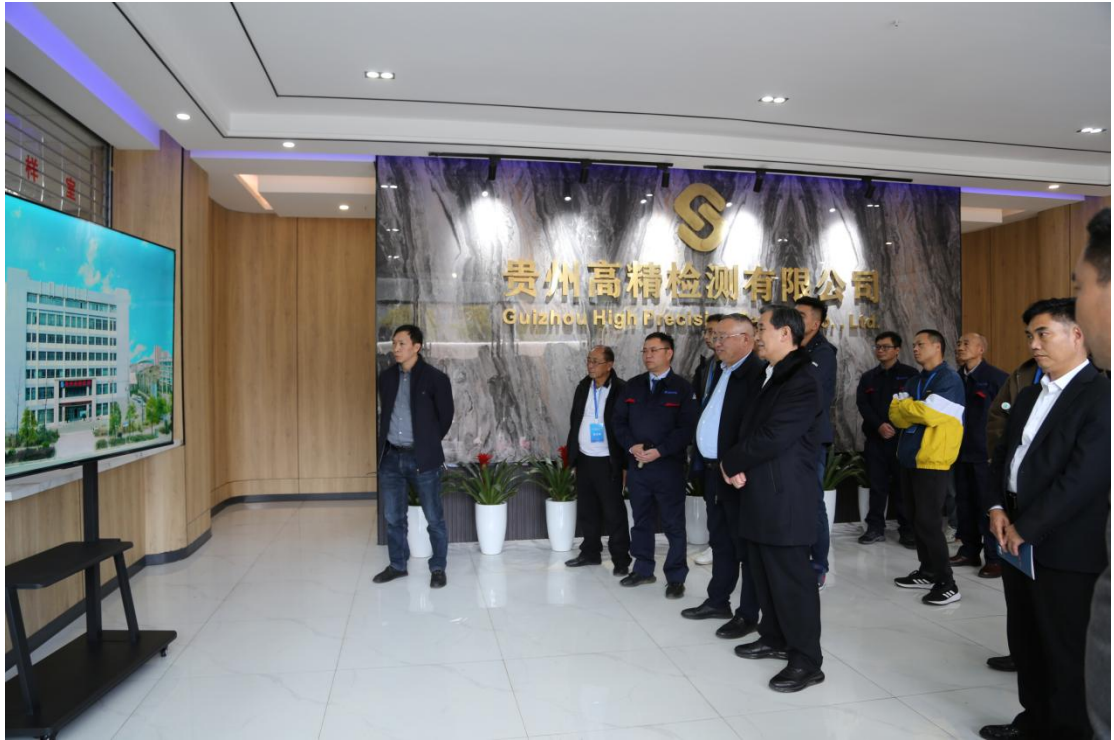
观摩组一行观看公司宣传片