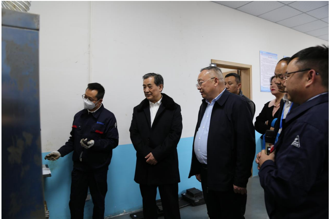
观摩组一行参观燃烧实验室