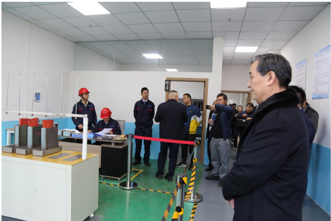
观摩组一行参观电气实验室