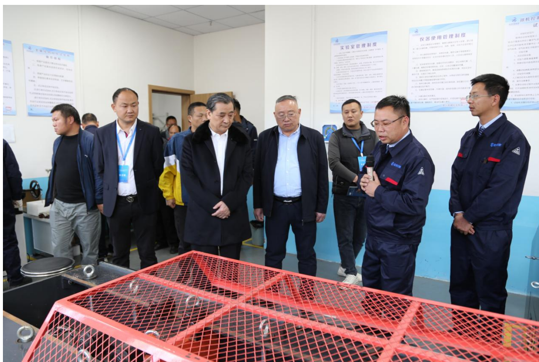
观摩组一行参观力学实验室